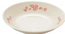
㉑深丸皿 20cm MK-115