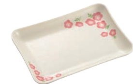
⑭角皿(大) 切立 MK-29